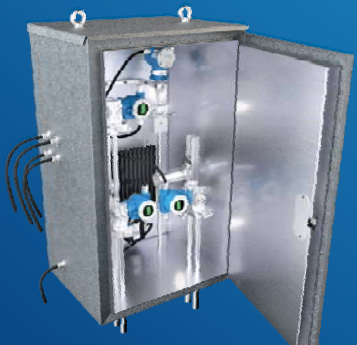
Термошкаф классического раскрытия РизурБокс-М-РК