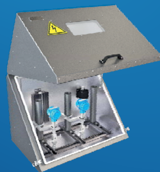
Термошкафы диагонального раскрытия РизурБокс-М-РД