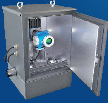
Термошкаф горизонтально разъемный классического раскрытия РизурБокс-М-РГ

Термошкафы производятся из материалов, не поддерживающих горение, и имеют все необходимые сертификаты.